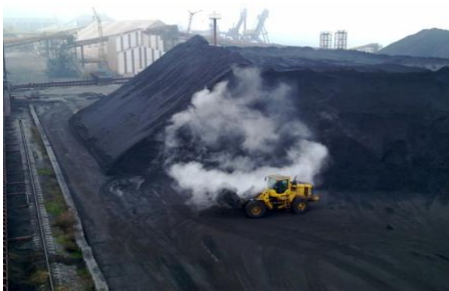
Рис. 2. Штабели угля на территории промышленного объекта

Вторая проблема – загрязнение рабочих зон возле штабелей угля (рис. 2), которые находятся на территории шахт, коксохимических предприятий и других объектов.