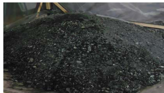
Рис. 6. Модель угольного штабеля

Для оценки степени уменьшения пылевыведения от поверхности угля, при применении раствора, был проведен физический эксперимент. В лабораторных условиях была изготовлена модель угольного штабеля в масштабе 1:10 (рис. 6).