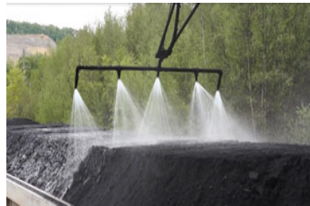
Рис. 3. Подача воды на уголь в полувагонах

В последнее время значительно повысился интерес к разработке методов защиты от пылевого загрязнения рабочих зон на прилегающей территории и на территории предприятий, где используют уголь [1, 2, 4, 5, 7, 8, 15, 17]. Существуют различные методы решения этой задачи. Например, могут использоваться специальные крышки, которые устанавливаются на полувагоны [15]. Такие крышки позволяют существенно уменьшить уровень загрязнения прилегающей территории, но являются очень дорогими. Наиболее часто для уменьшения Уноса угольной пыли используют смачивание водой поверхности транспортируемого груза (рис. 3).