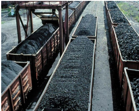
Рис. 1. Транспортировка угля

В Украине происходит интенсивная добыча угля, что обусловлено большими его запасами на территории страны. При добыче угля, его транспортировке возникает комплекс проблем [1, 2, 5, 7–9, 14, 16–18], где можно выделить две, наиболее острые. Первая проблема – это загрязнение угольной пылью прилегающей территории во время перевозки угля в полувагонах [1, 2, 15, 18] (рис.1).