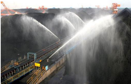
Рис. 4. Применение водяных пушек для подачи воды на поверхность угольного штабеля

Fig. 4. The use of water cannons to supply water to the surface of the coal pile