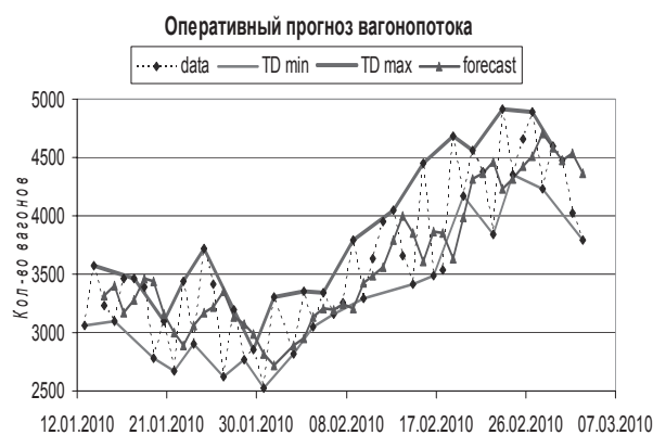
Рис. 3. Оперативный прогноз вагонопотока с использованием «бутстреп»

Прогнозы по каждой выборке усреднили. Для прогноза, который представлен на рис. 3, количество выборок, полученных с помощью «бутстреп», равно 5, при этом относительная ошибка прогноза от фактического составила e(\hat{Y}) = 8,77\% .