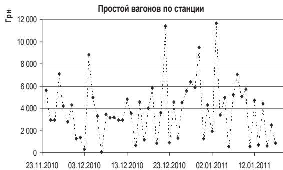
Рис. 4. Простой вагонов по станции в денежном выражении

Также было установлено, что с помощью адаптированного метода Т. Демарка можно прогнозировать и другие показатели. К примеру, на рис. 4 представлен временной ряд простоя вагонов на станции в денежном выражении.