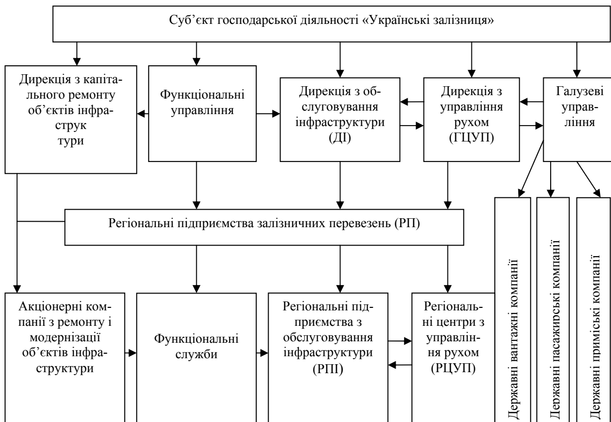
Рис. 2. Організаційна структура залізниць країни функціонально-об'єктної системи управління