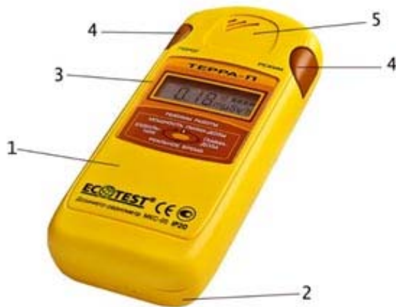
Рис. 1. Дозиметр-радіометр МКС-0,5 «Терра-П»