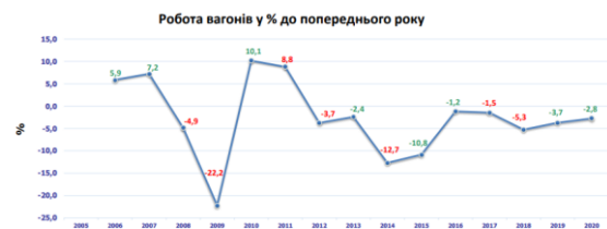
Рис. 2. Динаміка зміни роботи вагонів робочого парку у відсотках до попереднього року

Fig. 1. Dynamics of changes in the load of working fleet cars as a percentage of the previous year