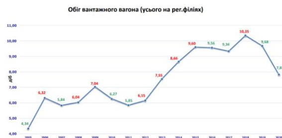
Рис. 4. Аналіз обігу вантажного вагона з 2005 по 2020pp

Fig. 3. Dynamics of changes in freight shipments as a percentage of the previous year