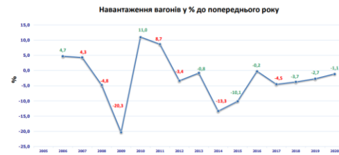
Рис. 1. Динаміка зміни навантаження вагонів робочого парку у відсотках до попереднього року

Однак слід зауважити, що разом із позитивними тенденціями, що склалося до початку повномасштабної війни, спостерігалася негативна тенденція щодо основних якісних показників. Одним із таких комплексних показників є обіг вантажного вагона (рис. 4).