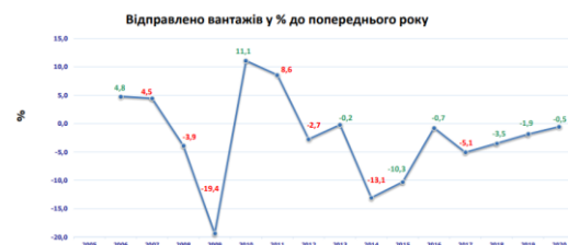
Рис. 3. Динаміка зміни відправлення вантажів у відсотках до попереднього року

Fig. 2. Dynamics of changes in the operation of working fleet cars as a percentage of the previous year