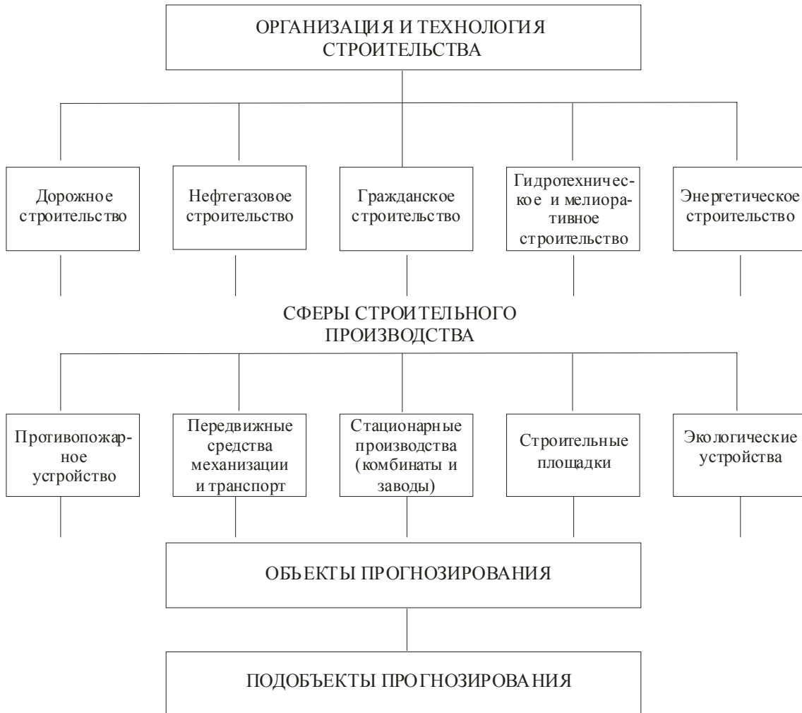
Рис. 1. Организация и технология строительства

Переходя в этом уравнении от приращений к дифференциалам и интегрируя его в пределах от нуля (базис) до t (время прогнозирования), будем иметь: