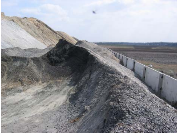
Рис. 1. Відвали забрудненого баластного щебеню

високим будівельно-технічним вимогам. При цьому мова йде про чисте ломане природне каміння з особливими вимогами щодо якості каменю, форми та розмірів (як правило, між 25 та 45 (60) мм). Товщина шару щебеню до нижньої поверхні шпал складає 30 см, відповідно розрахунковій швидкості руху та передбачуваного навантаження на залізничний шлях.