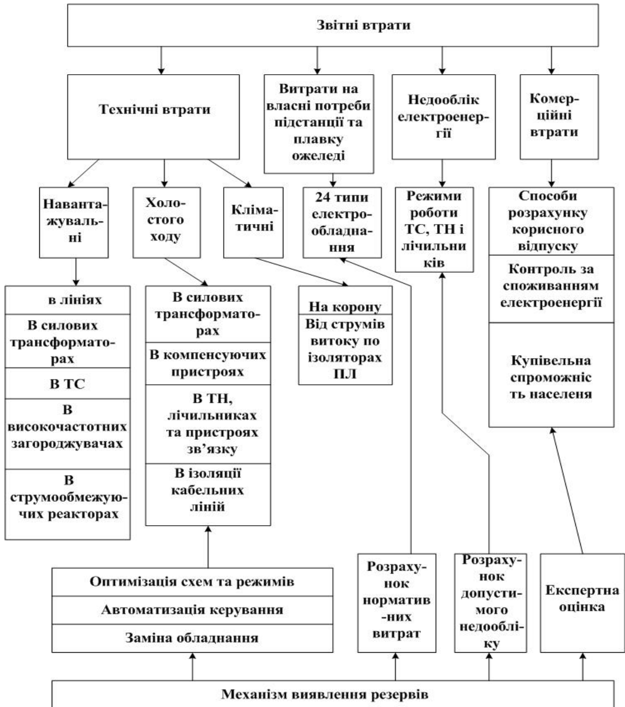
Рис.1. Детальна структура звітних втрат електроенергії

якої втрати розділені на складові, виходячи з їхньої фізичної природи й специфіки методів визначення їхніх кількісних значень (рис. 1).