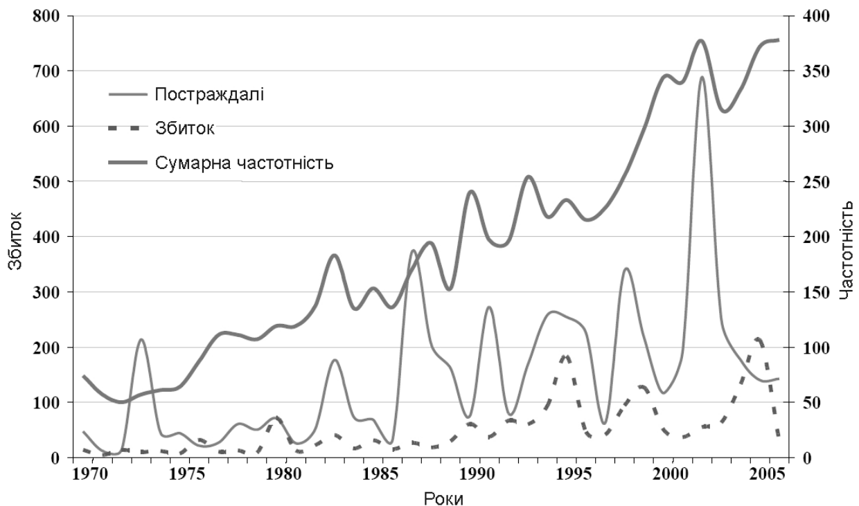
Рис. 1. Стихійні лиха в світі

ми [2], що призводить до великих збитків людства (рис. 1).