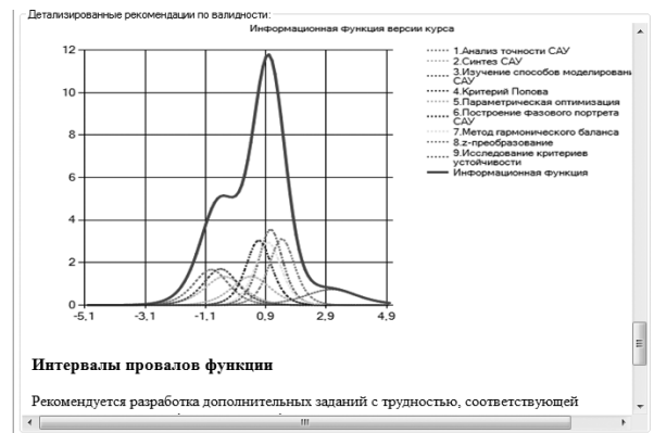
Рис. 2. Графическое представление результатов вычислений по валидности

Рекомендации по совершенствованию качества ЭОР предоставляются как в графической (рис. 2), так и в текстовой, и в табличной форме по каждому показателю, что обеспечивает визуализацию результатов вычислений для ЛПР.