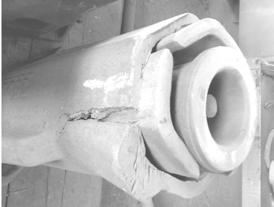
Рис. 4. Пошкодження корпусу поглинального апарату Ш-2-В

різко повертається в початкове положення з ударом по передньому упору та хвостовику автотцепи. Вказані фактори негативно впливають на динаміку рухомого складу, значно підвищують зношення деталей, а також можуть приводити до значних пошкоджень (рис. 4).