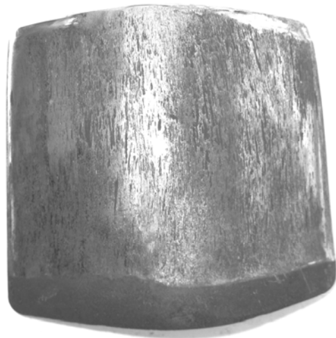
Рис. 2. Фотографія фрикційного клину

Фрикційний клин може знаходитись у двох станах – покою або руху. При роботі поглинального апарату поверхні, що труться, нагріваються, пластично деформуються, активуються, відбувається переміщення клину на якусь відстань (випадкову), на деякий час клин зупиняється, потім знову відбувається «зрив», клин знову переміщується вздовж корпусу і так далі. Довжина переміщення (стрибка) і час зупинки є випадковими і залежать відповідно від статичної характеристики контактуючих поверхонь та кінетичної характеристики тертя.