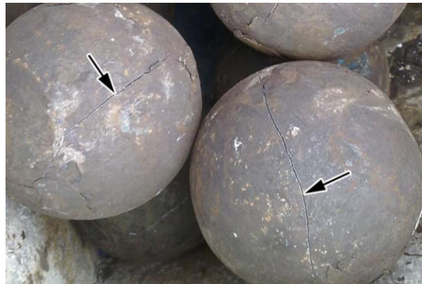
Рис. 1. Трещины на поверхности шаров, обработанных по режиму № 1

в течение 10 ч – через 48 ч после завершения отпуска. Увеличение температуры отпуска до 200\text{--}300\text{ }^\circ\text{C} полностью предотвратило растрескивание даже при минимальной продолжительности отпуска; трещины не появились на таких шарах даже спустя месяц после завершения отпуска.