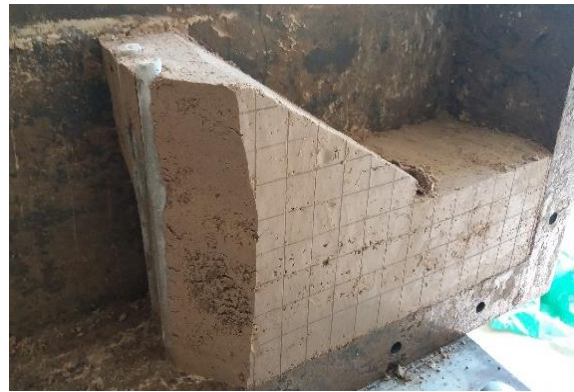
Fig. 5. Appearance of the soil cement elements in the bank body after the test

According to the results of experimental studies, it can be seen that when testing a model with cement piles, compared with a model without soil cement piles, the relative deformations of the samples taken prior to the experiment and after the experiment almost coincide, indicating a decrease in deformability under load.