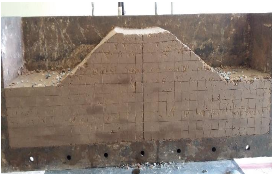
Fig. 4. Soil sample after the test