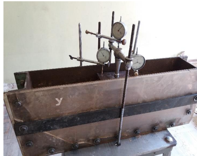
Fig. 1. Model of soil bank in trough with measuring devices.

loaded the tested model fixing the readings of the measuring devices.